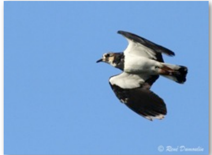
Vanneau huppé, en vol