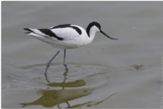
Avocette élégante (Recurvirostra avosetta)

L'avocette élégante est l'un des limicoles les plus facile à observer et à déterminer. C'est un oiseau assez haut sur patte, au plumage noir et blanc et qui a la particularité d'avoir son bec courbé vers le haut. Ses pattes sont souvent grises à bleues. Un autre limicole reconnaissable est l'huîtrier pie, que nous avons vu en quantité près du camping et ailleurs. Possédant également un plumage noir et blanc, il se caractérise par un bec et des pattes rouges vifs.