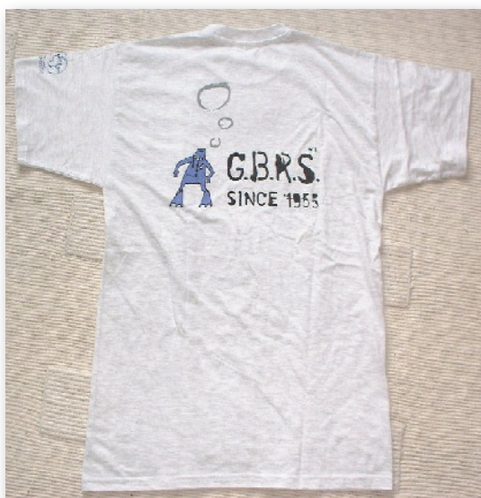
T-shirt GBRS – 10,00 €