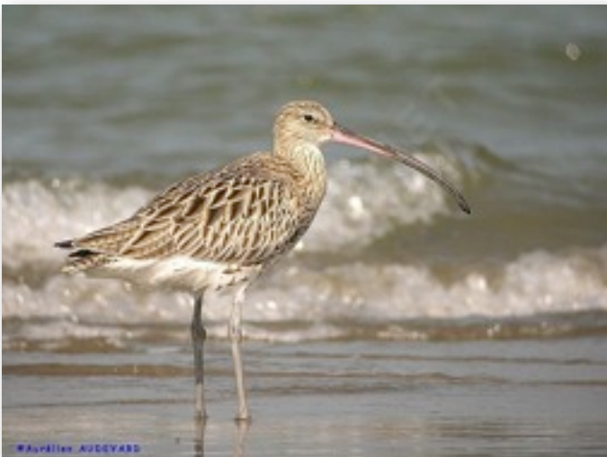
Courlis cendré (Numenius arquata)

Un peu plus rares, les courlis sont des oiseaux dans les tons bruns ayant la particularité d'avoir leur bec courbé vers le bas, le contraire de l'avocette donc. Nous n'avons pas pu identifier jusqu'à l'espèce celui que nous avons observé, mais il s'agissait probablement d'un courlis cendré. Les barges sont