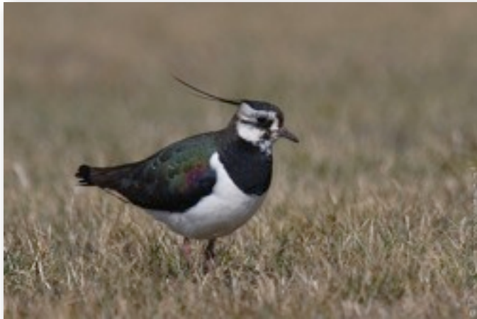
Vanneau huppé (Vanellus vanellus)

Il y avait également un grand nombre de vanneaux huppés, aux abords du camping. On le voit sur les côtes mais aussi à l'intérieur des terres. Outre le fait qu'il possède une « huppe » sur la tête, il est aussi facilement reconnaissable en vol par le fait qu'il possède des ailes larges et arrondies aux extrémités. On les voit souvent faire des voltiges (notamment pour défendre le nid).