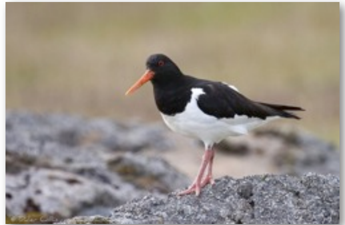
Huîtrier pie (Haematopus ostralegus)

Un peu plus rares, les courlis sont des oiseaux dans les tons bruns ayant la particularité d'avoir leur bec courbé vers le bas, le contraire de l'avocette donc. Nous n'avons pas pu identifier jusqu'à l'espèce celui que nous avons observé, mais il s'agissait probablement d'un courlis cendré. Les barges sont