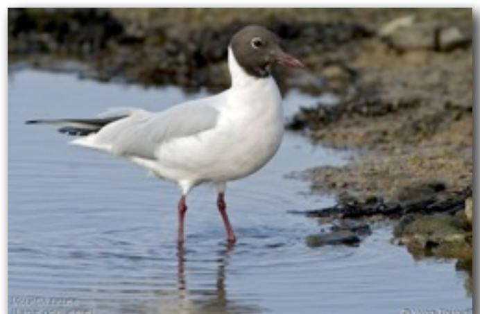
Mouette rieuse (Chroicocephalus ridibundus)