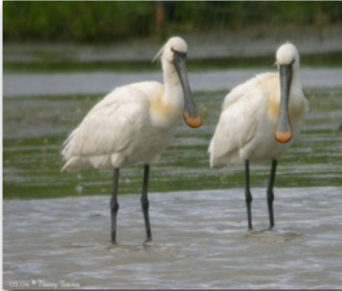
Spatules blanches (Platalea leucorodia)