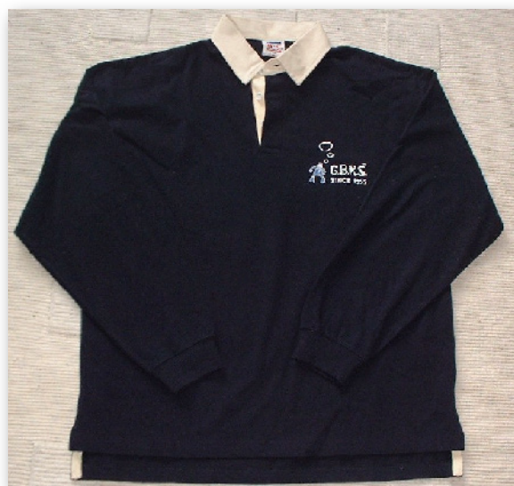
Polo Rugby GBRS – 25,00 €