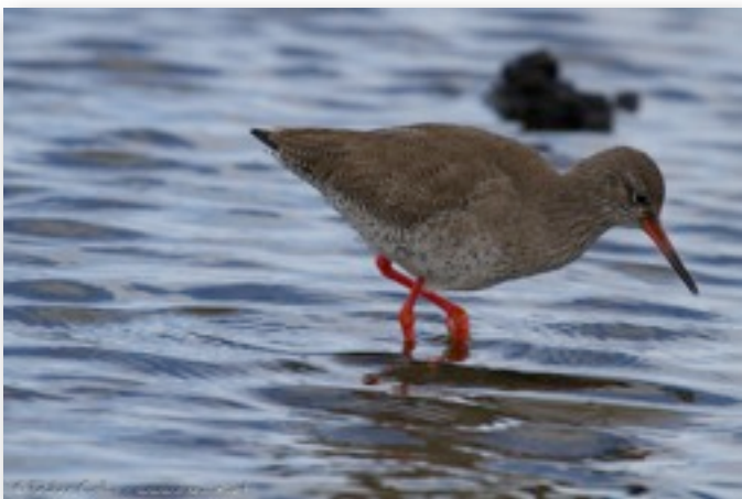
Chevalier gambette (Tringa totanus)