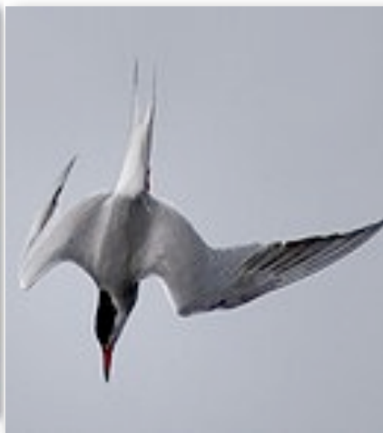
Sterne pierregarin (Sterna hirundo)