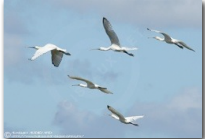
Spatules blanches, en vol