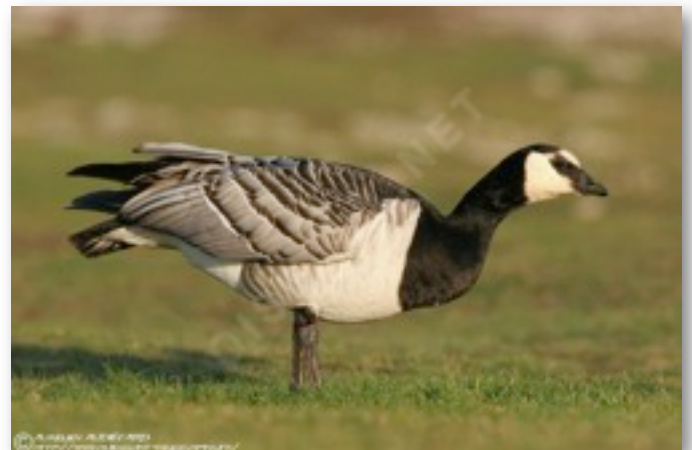
Bernache nonnette (Branta leucopsis)

Nous avons également observé une autre espèce d'oie, du type oie cendrée ou oie des moissons mais sans pouvoir l'identifier avec exactitude. Enfin, nous avons aussi vu un grèbe huppé et des tadornes de belon.