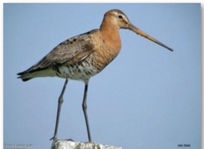
Barge à queue noire (Limosa limosa)