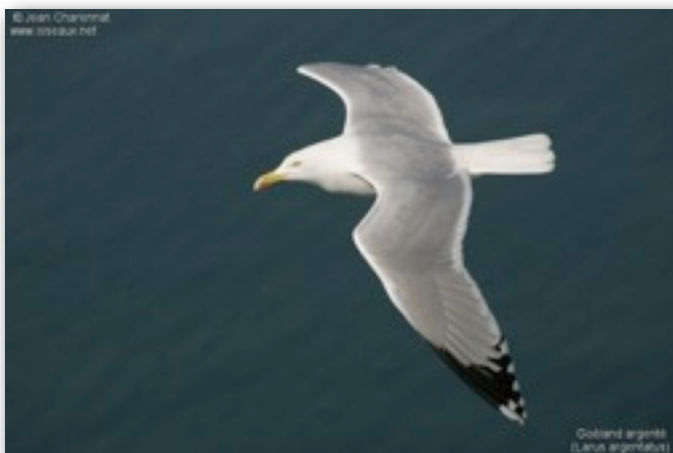
Goéland argenté (Larus argentatus)