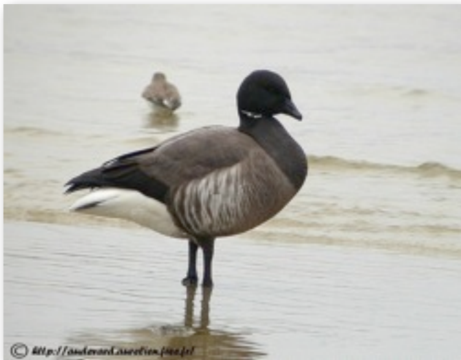
Bernache cravant (Branta bernicla)

Tout d'abords, nous avons répertorié deux espèces de bernaches : la bernache cravant (les plus nombreuses) et la bernache nonnette. Les différences morphologiques facilement observables se situent au niveau de la tête : elle est noire chez la première et noire et blanche chez la seconde. Celles qui passaient en grands groupes au-dessus du camping étaient principalement des bernaches cravant.