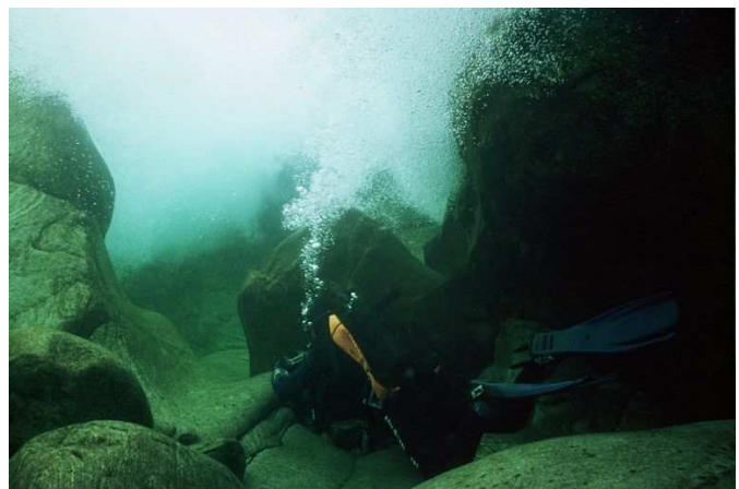
Manu s'approche de la cascade, bien lesté pour ne pas se faire emporter!

La plongée se termine par une cascade dont on peut faire le tour sous l'eau. La force de cette dernière est impressionnante et on est obligé de se lester avec de gros cailloux pour ne pas se faire aspirer!