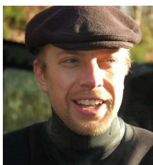
Texte et photos : Yannick Dewael