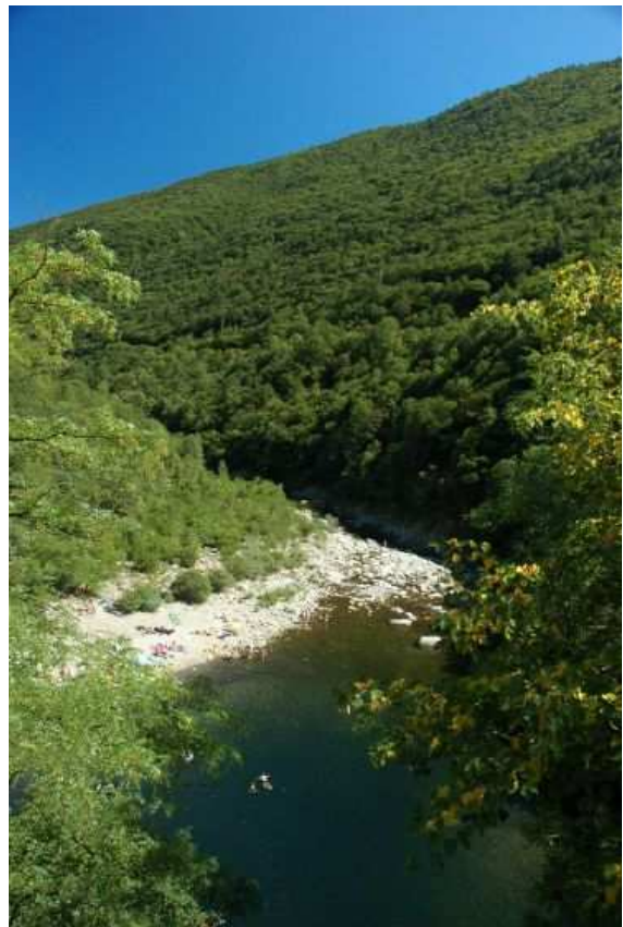
Val Cannobino, Italie

Plongée dans une rivière très encaissée (falaises d'environ 50m!), jusqu'à 13m de profondeur. Eau chaude et bien claire.