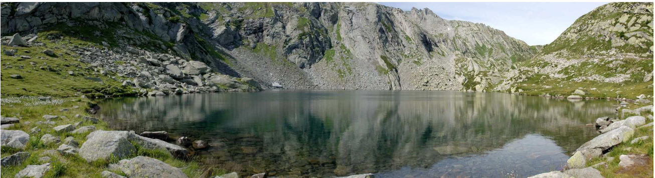
Laghetti del Naret

Le lendemain matin, plongée dans le Laghetti del Naret, lac situé à 2080 m. L'eau y est limpide, froide (4°C!). L'environnement est minéral. La plongée est très belle.