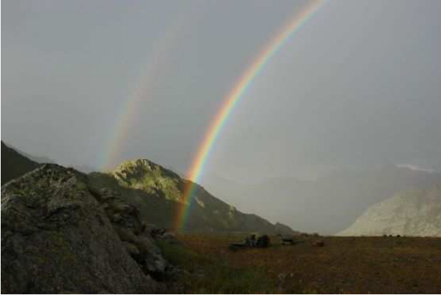
La récompense après l'orage...