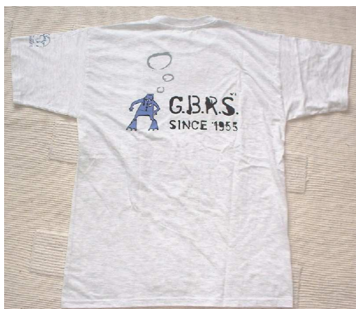
T-shirt : 10 € pièce

• Nous pouvons également vous annoncer que les t-shirts et les polos réalisés à l'occasion de cet anniversaire sont dès à présent en vente (chez Yannick ou Vincent).