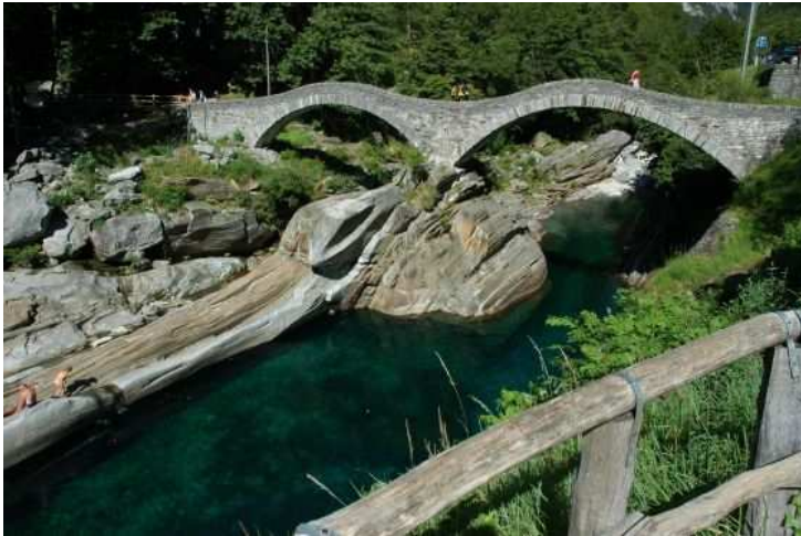
Pont romain enjambant la Verzasca

Ce vendredi, nous plongeons trois fois d'affilée dans la Verzasca. L'eau est limpide, superbe, les rayons de soleil viennent se refléter sur la roche, donnant de magnifiques images.