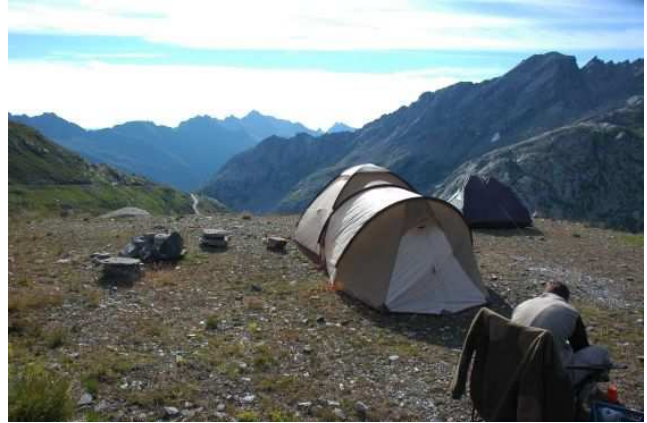
Vue de notre bivouac, à 2300m d'altitude

Le lendemain matin, plongée dans le Laghetti del Naret, lac situé à 2080 m. L'eau y est limpide, froide (4°C!). L'environnement est minéral. La plongée est très belle.