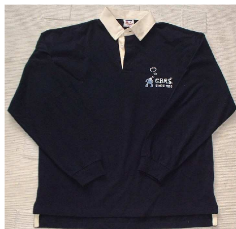
Polo : 25 € pièce

• Une bière avec comme étiquette le logo des 50 ans sera également en vente d'ici quelques semaines. On vous tiendra au courant dans notre prochain GBRS News.