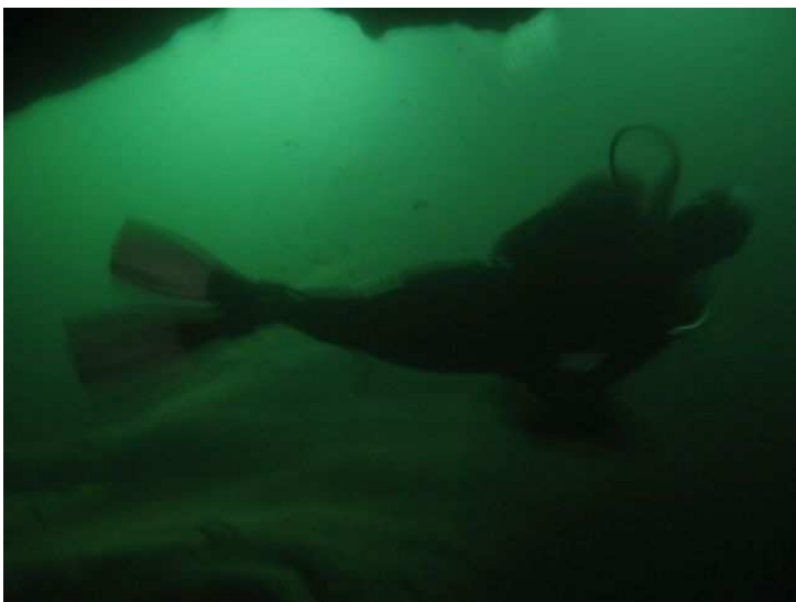
Vincent vu d'en bas

Après cette belle plongée, retour en Suisse dans la Valle Verzasca pour un magnifique bivouac sur les hauteurs.